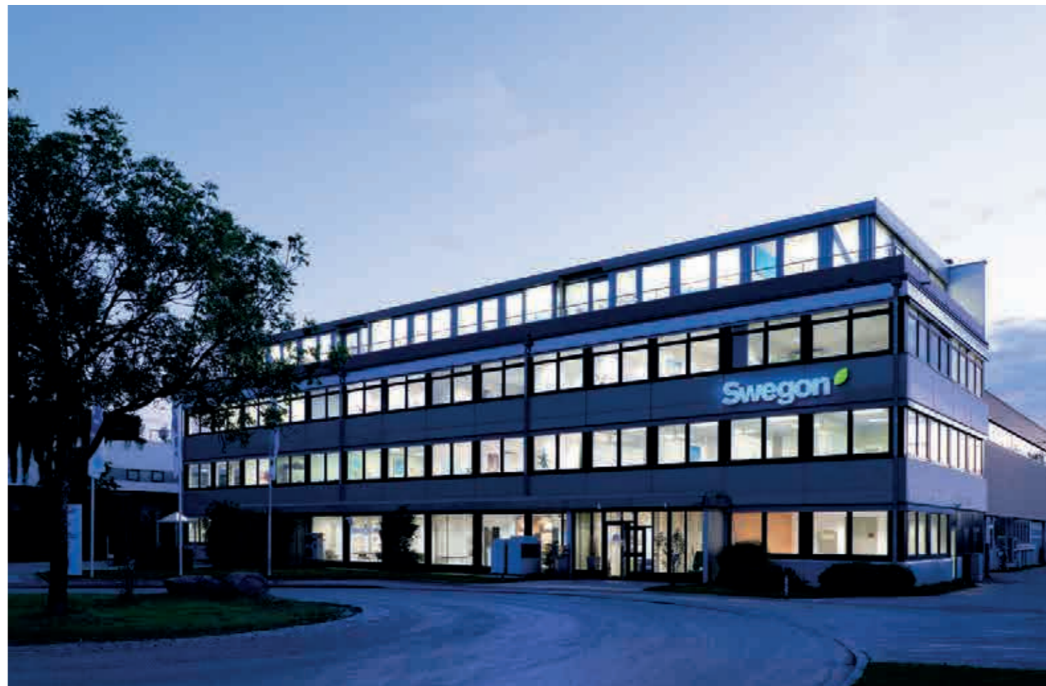
Garching, Deutschland, Hauptquartier Swegon Germany GmbH

Heute sind unsere deutschen Spezialitäten die umfangreiche Projektbetreuung, das flächendeckende Vertriebs- und Servicenetz sowie das besonders breite Portfolio. Wir betreuen unsere Kunden von 13 Standorten aus. Neben unserem eigenen Produktangebot sind wir exklusiver Vertriebspartner für alle Fujitsu Klimageräte.