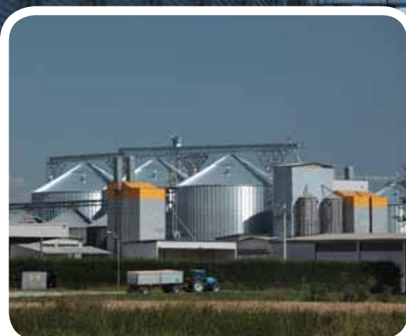
Silos in lamiera ondulata

Our sheet metal silos are ideal for storing granular products such as cereals with specific weight of 840 kg/m 3 . All structural components of the silos, roof cylinders and uprights are galvanized using the SENDZIMIR method 450 g/m 3 to ensure extremely long resistance to atmospheric agents. The cylinders are made up of S350 GD structural sheet steel panels in accordance with EN 10326 (2004).