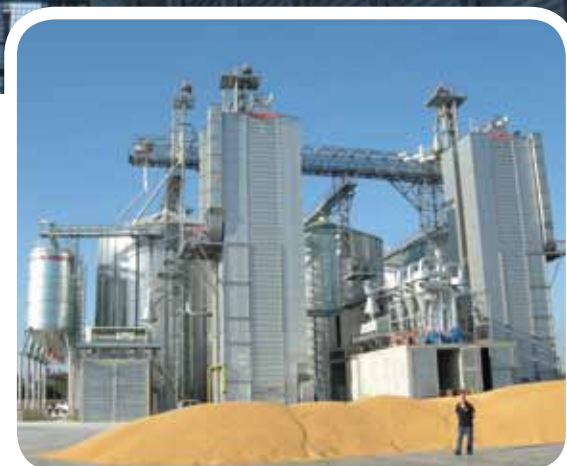
Corrugated sheet metal silos