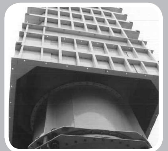
Silos a celle quadre