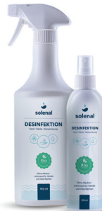
Hand- und Flächendesinfektion, 750 ml & 250 ml

Sorgt für angenehme Raumluft. In Kombi- nation mit Solenal Raumdesinfektion werden Bakterien, Pilze und Viren aus der Raumluft entfernt.