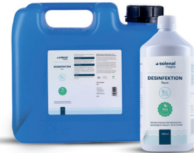
Raumdesinfektion 10 l, 5 l, 1 l

Die handliche Lösung für kleine und mittlere Räume.