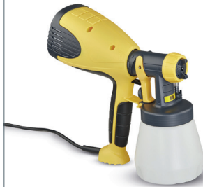
Solenal Kaltvernebler K. 200

Zur Desinfektion von großen Räumen & Hallen.