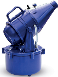
Solenal Kaltvernebler K. 4000

Zur Desinfektion von großen Räumen & Hallen.