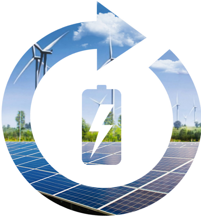
Energie der Zukunft