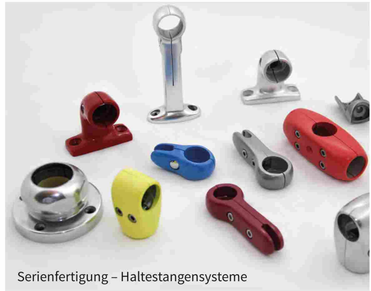
Serienfertigung – Haltestangensysteme