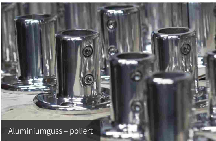
Aluminiumguss – poliert