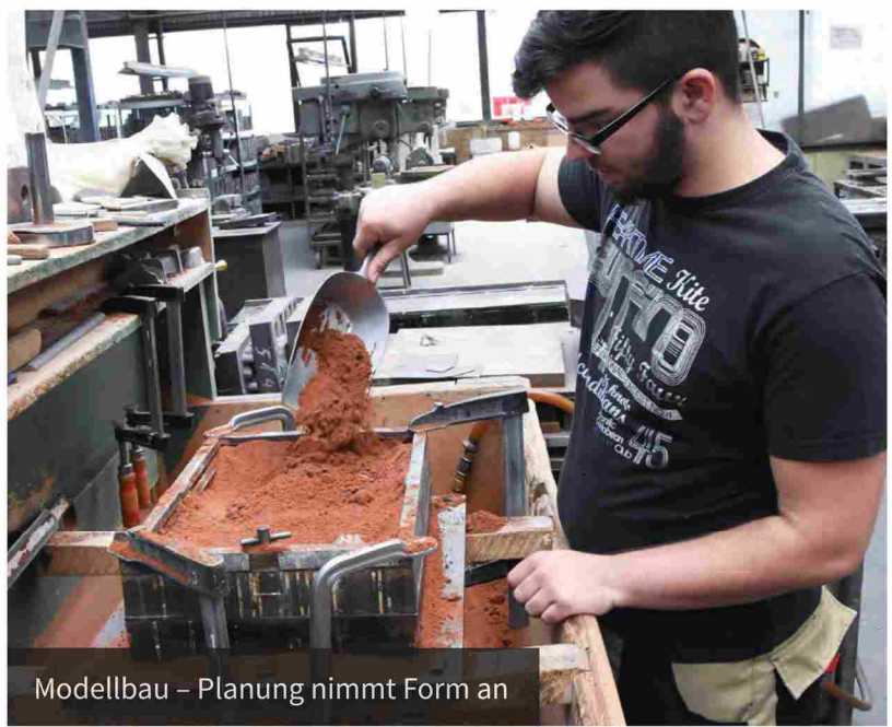
Modellbau – Planung nimmt Form an

Aluminiumguss Stahl- und Edelstahlguss Manganhartstahl Zinkguss GG · GGG · GTW Hartguss Systemkomponenten Bearbeitung Montage