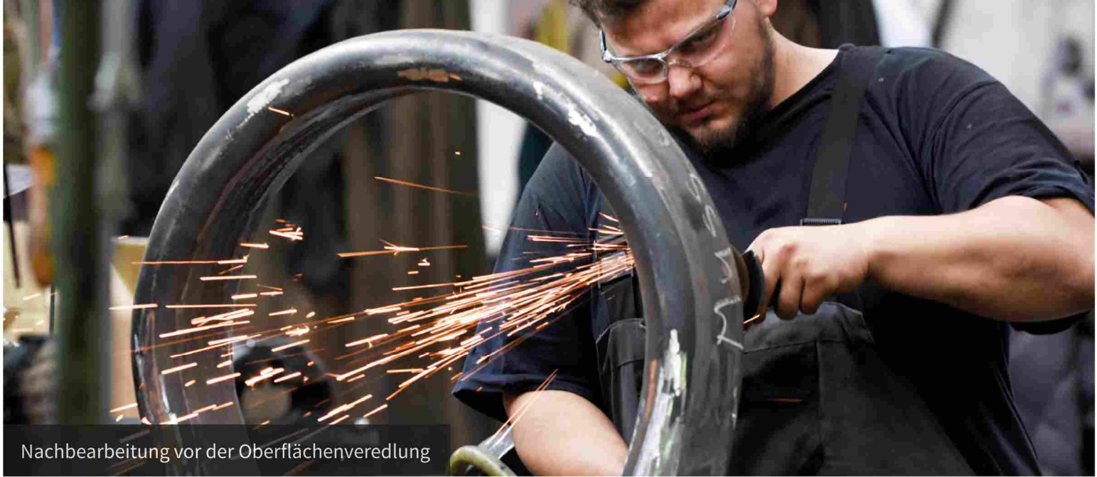
Nachbearbeitung vor der Oberflächenveredlung