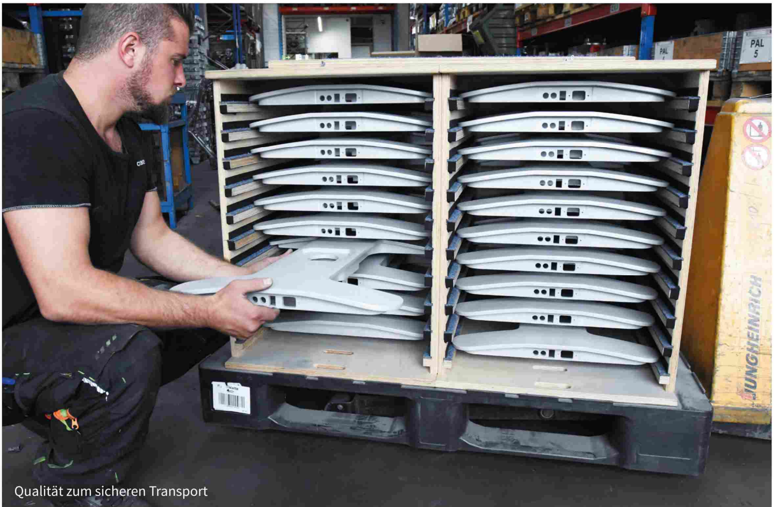
Qualität zum sicheren Transport