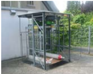
ETS / Risa 1000

zur Beförderung von DIN 1,1 Rollcontainer und Paletten, TÜV und abnahmefrei