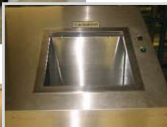
pneumatische Einwurfstation in Edelstahl