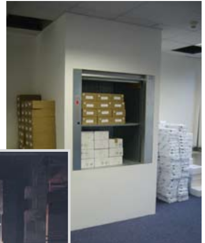
Traglast 200 kg