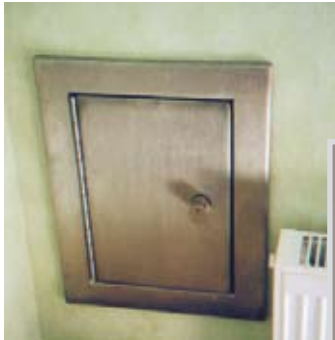
ETS - W8