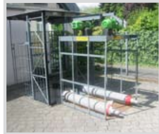
ETS / Risa 1000