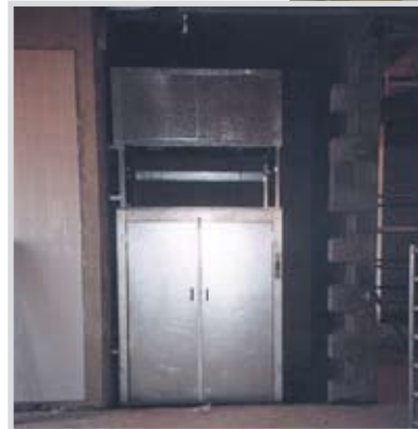
Traglast 500 kg (im Bau)