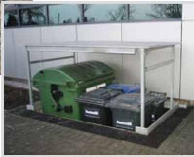
Traglast 2000 kg