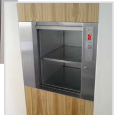
Traglast 50 kg