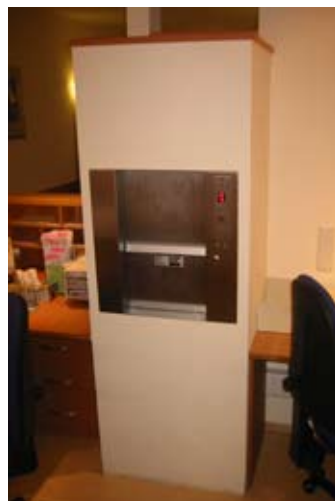
Traglast 5 kg (freistehend mit Verkleidung)

Güteüberwacht nach DIN 18092, bzw. 18090, als vertikale zweiflügelige Schiebetür und ein- oder zweiflügelige Drehtür lieferbar. Türverschlüsse geprüft, bzw. mit Baumusterprüfung. Schiebetüren aufgehängt an zwei hochflexiblen Stahlseilen, über Aluminium-Seilrollen im Stahlkäfig geführt. Alle Türen im Zargenrahmen, einbaufertig vormontiert.