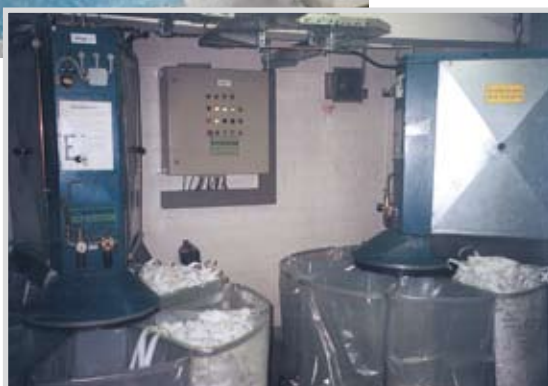
MSV / 8