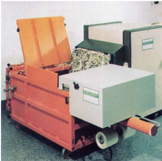
Förderband-Aktenvernichter und Ballenpresse

Sackabwurfanlage in einem Verwaltungsgebäude mit nachgeschaltetem Papierzerkleinerer und Müllkomprimator MSV