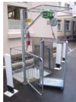
ETS 250 mit Rollwagen

* mit Mülltonnenaufhängung ** mit Faßgreifer *** mit endlos Hanfseilschlaufe