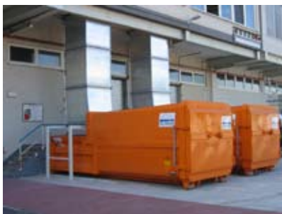
Bilder von Industrieanlagen