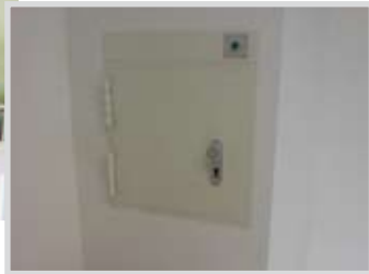
SSE-T30 / T-90