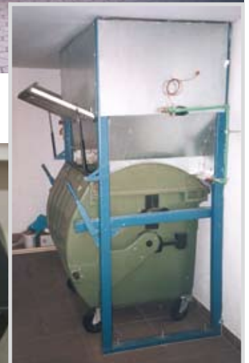
G-3 mit Müllschacht