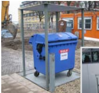
Traglast 1000 kg