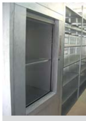
Traglast 200 kg (freistehend mit Verkleidung)