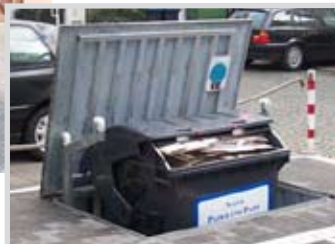
Versenkbare Mülltonnen 1,0