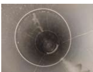
Wäscheabwurfschacht nach einer Hochdruckreinigung