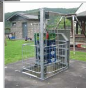
ETS 500 Traglast 500 kg