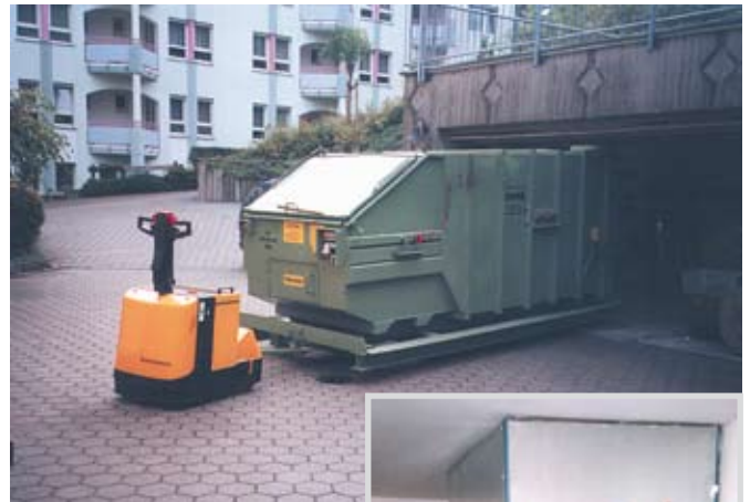
Presscontainer mit Fahrwerk und Schlepper