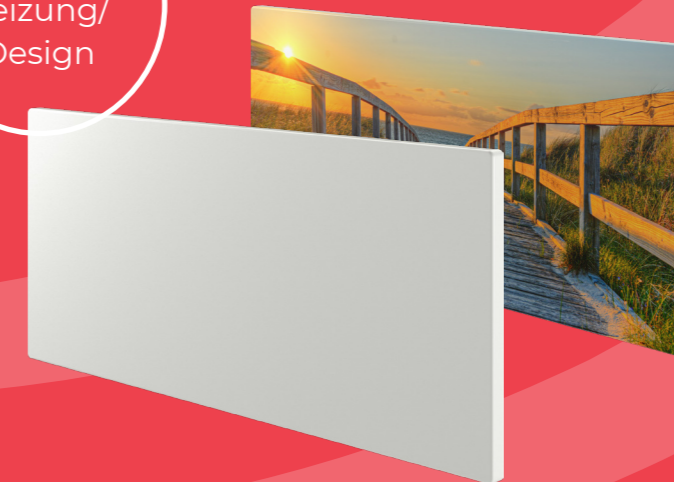
Infrarot- heizung/ Design