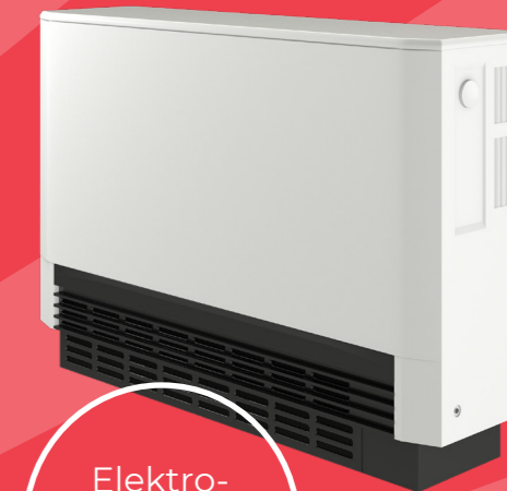
Elektro- speicher- heizung