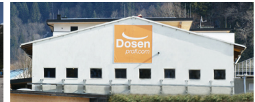
Pirlo Dosenprofi GmbH Stockach 100 6306 Söll/Austria