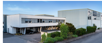
Pirlo Industrial GmbH & Co OG Industriezeile 8 2100 Korneuburg/Austria