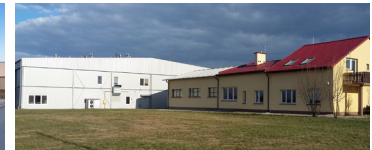
Pirlo Poland Sp. z o.o. Działki Suskowolskie 78 26-670 Pionki/Poland