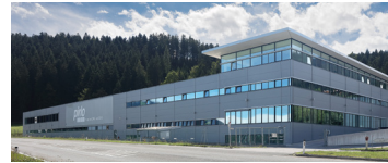
Österreichische Blechwarenfabrik Pirlo GmbH & Co KG Werk Cans 2, Zentrale Plant Cans 2, Headquarters Stockach 100 6306 Söll/Austria