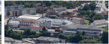
Österreichische Blechwarenfabrik Pirlo GmbH & Co KG Werk Cans 1 Plant Cans 1 Hugo-Petters-Straße 8-14 6330 Kufstein/Austria