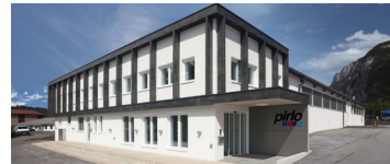
Pirlo Tubes GmbH Trautweinstraße 2 6330 Kufstein/Austria