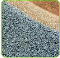
Steine und Erden