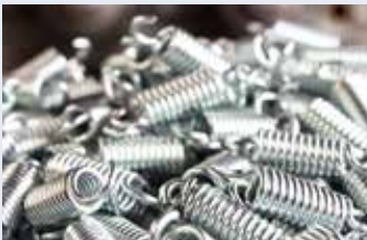
Zugfedern · Tension Springs Ressorts de traction