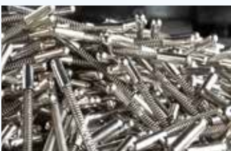
Federhülsen · Spring Sleeves Ressorts avec douilles