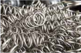
Druckfedern · Compression Springs Ressorts de compression