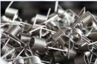
Schenkelfedern · Torsion Springs Ressorts de torsion