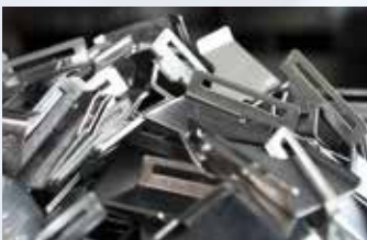
Stanzbiegeteile · Leave Springs Ressorts à lames