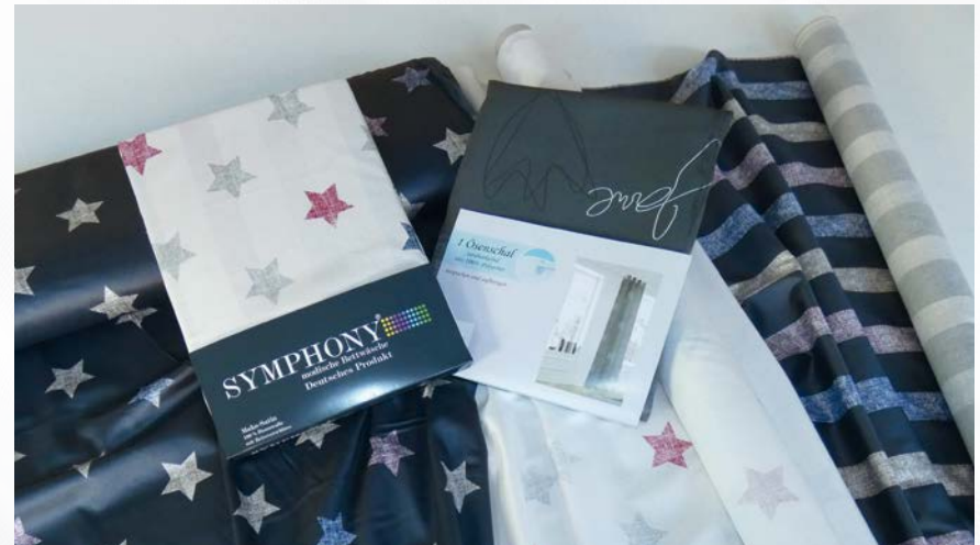
zum fertigen Produkt.