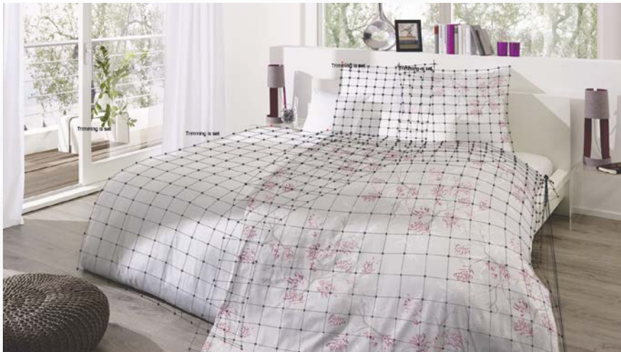
über den Entwurf ...