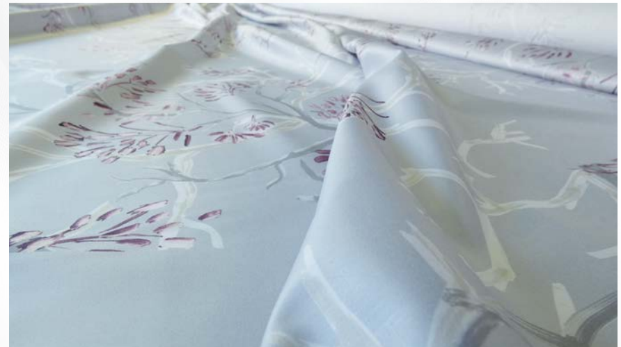
über den Digitaldruck ...